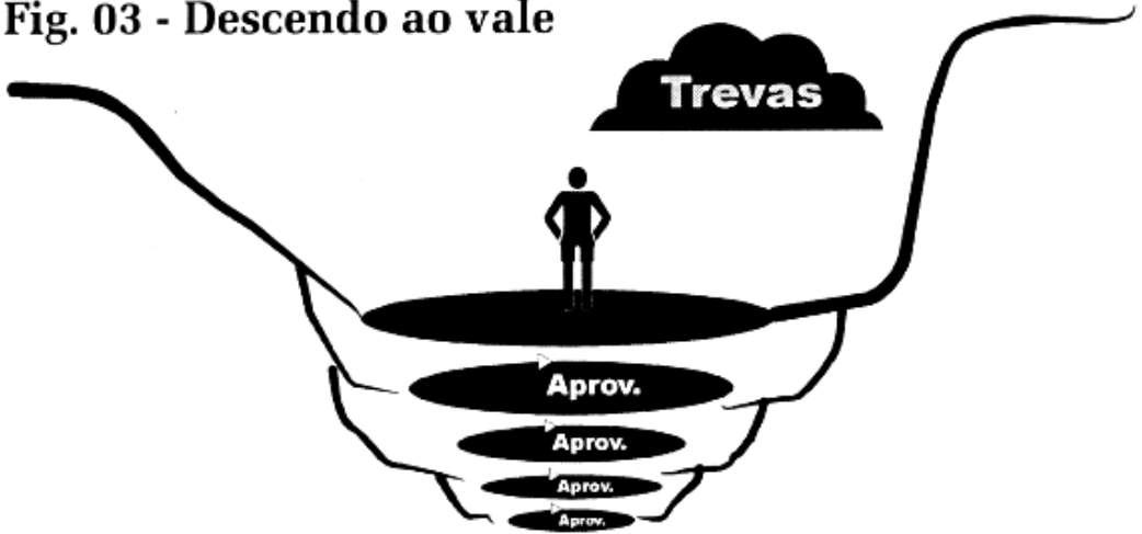
Fig. 03 - Descendo ao vale