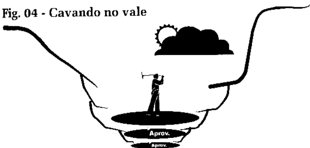
Fig. 04 - Cavando no vale

Cavamos mais e chegamos na tampa do bueiro da nossa alma. Numa figura de linguagem, começam a aparecer toda sorte de coisas repugnantes: "baratas", "lagartixas", "crocodilos", etc. Tudo "evangélico", é claro! Começamos a nos ver com os olhos de Deus. Entendemos a necessidade de enfrentar estas coisas que estavam a tanto tempo em nós mesmos e para as quais estávamos cegos.